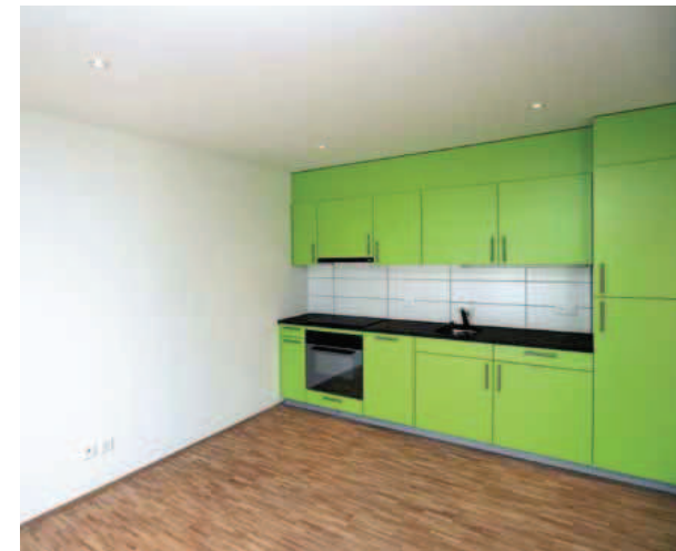
Les cuisines des appartements protégés sont ouvertes sur le salon pour faciliter les déplacements.