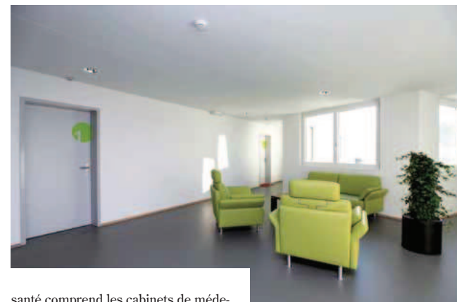
Chaque étage dispose d'un espace commun meublé de fauteuils.